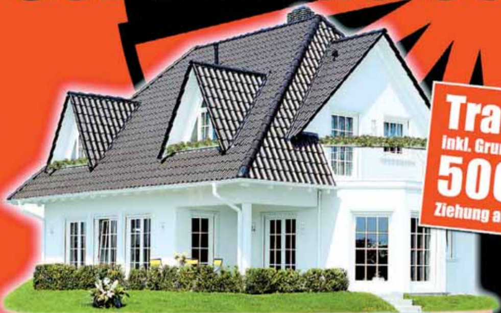
Abb. nur Modellbeispiel

Traumhaus inkl. Grundstück im Wert von 500.000,- Ziehung am Samstag, 11.11.06