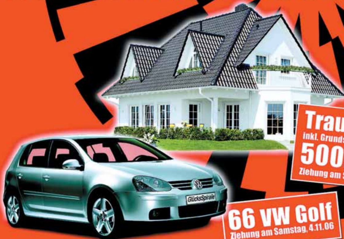
Abb. nur Modellbeispiel

Traumhaus inkl. Grundstück im Wert von 500.000,- Ziehung am Samstag, 11.11.06