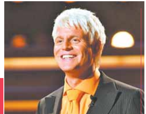
Moderator Guido Cantz freut sich auf spannende Momente.

Jeden Mittwoch, 20.15 Uhr, und jeden Sams- tag, 19.15 Uhr, stellt Moderator Guido Cantz bei Sat.1 seine Kandidaten wieder vor die Wahl. Die Spielshow, in deren Mittelpunkt 26 Geldkoffer stehen, ist eine überarbeitete Neu- auflage des erfolgreichen Formats des Vorjah- res. Schon damals hieß es im Sommer „Deal or no Deal“, also „Kaufen oder nicht kaufen“, was schon sehr nach einem Nervenkrimi klingt. Und so wird es dann auch einer!