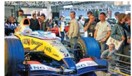
Besucher auf der AMI 2007.

Vom 5. bis 13. April 2008 erwartet die Auto Mobil International in Leipzig als wichtigste Automobilmesse des Jahres in Deutschland und Mitteleuropa auf 120.000 Quadratmetern rund 470 Aussteller, darunter 50 Fahrzeug-Marken mit voraussichtlich über 100 Modellpremierieren.