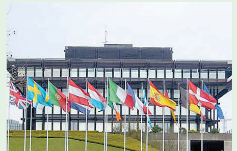
Der Europäische Gerichtshof (EuGH) in Luxemburg.

Bot ist der bisherigen Linie des Gerichtshofes gefolgt, nach der ein ausschließlich staatliches Glücksspielangebot zulässig ist. In seinen europaweit relevanten Schlussanträgen zu zwei niederländischen Fällen macht der Generalanwalt deutlich, dass Lizenzen aus EU-Mitgliedstaaten nicht in anderen Mitgliedsstaaten anerkannt werden müssen.