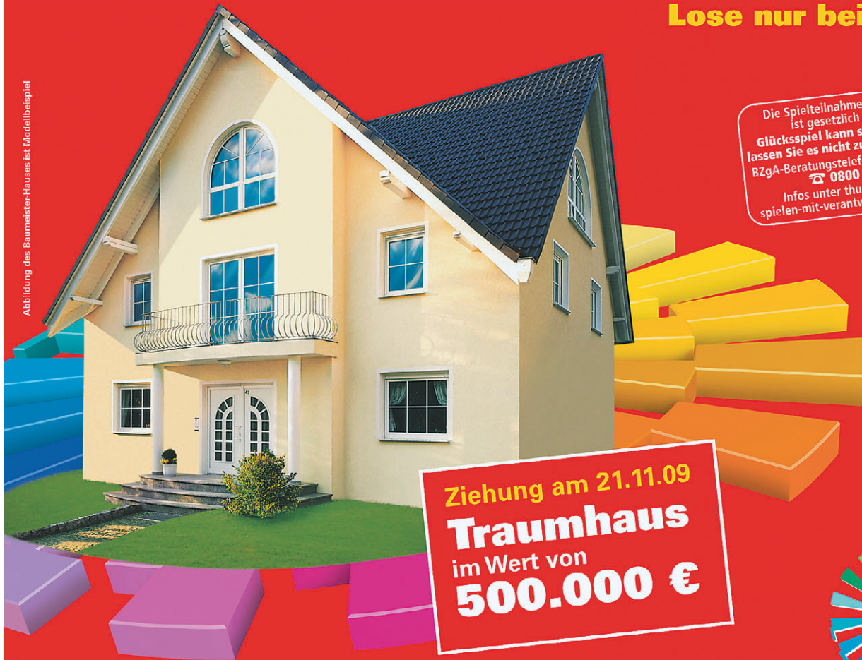
Abbildung des Baumeister-Hauses ist Modellbeispiel

Ziehung am 21.11.09 Traumhaus im Wert von 500.000 €