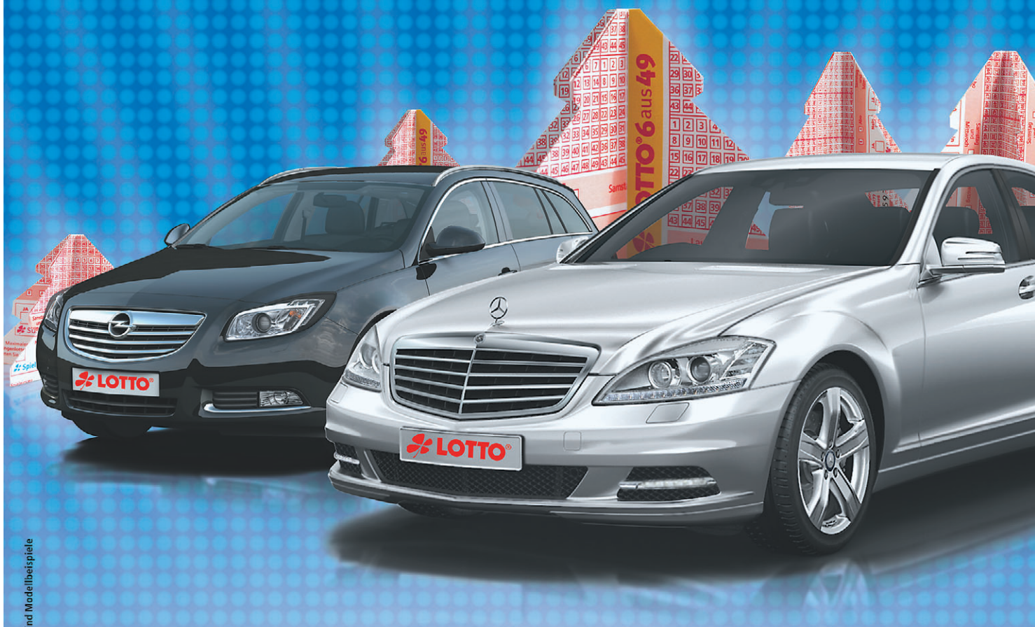
Abbildungen sind Modellbeispiele

An der Auslosung der Zusatzgewinne des Deutschen Lotto- und Totoblocks nahmen alle zur Ziehung am Mittwoch, dem 02. Dezember 2009, und am Samstag, dem 05. Dezember 2009, gültigen Spielaufträge mit Beteiligung an der Zusatzlotterie Spiel77 teil.